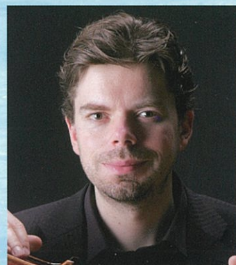
〔チェロ〕 マーティン・スタンツェライト