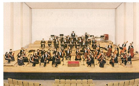
管弦楽：広島交響楽団