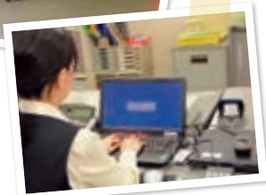
パソコン自動ログオフ