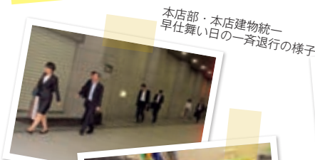
本店部・本店建物統一 早仕舞い日の一斉退行の様子