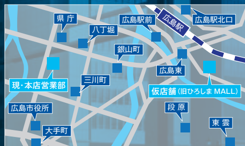
広島市内中心部店舗ネットワーク