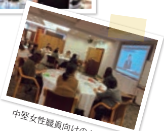
中堅女性職員向けのセミナー

「時間外勤務を前提としない働き方」の実現のため、意識・行動改革に向けた取組みを実施しています。