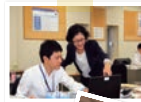
女性活躍推進や 積極的なキャリア 採用を実施