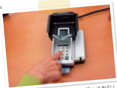
ピンパッド支払を活用した「印鑑レス取引」