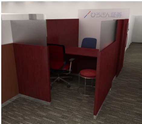
【参考1】「サテライトブース」設置店イメージ