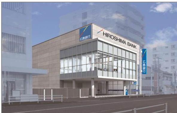
〔参考 1〕 新店舗外観図（イメージ）