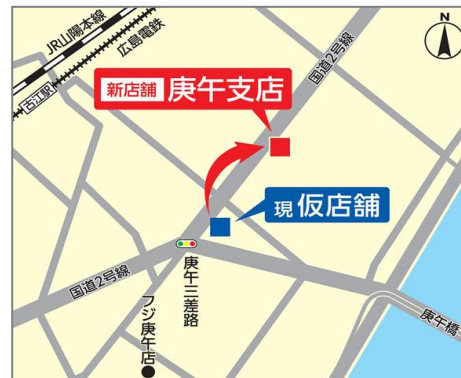
〔参考 2〕 周辺地図