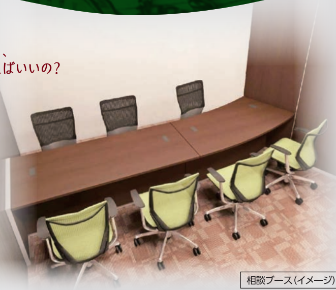
相談ブース(イメージ)