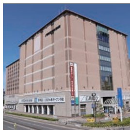
〈ひろぎん〉本店営業部(仮店舗)