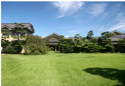
シンボルである芝生庭園