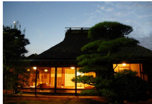
客室（離れ）の一室（藁の家）