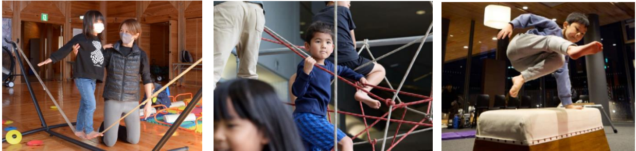
過去開催時の様子

※公共 R 不動産主催 NEXT PUBLIC AWARD 2023 にて「公園・道路」利活用部門グランプリ受賞