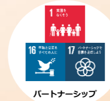
パートナーシップ